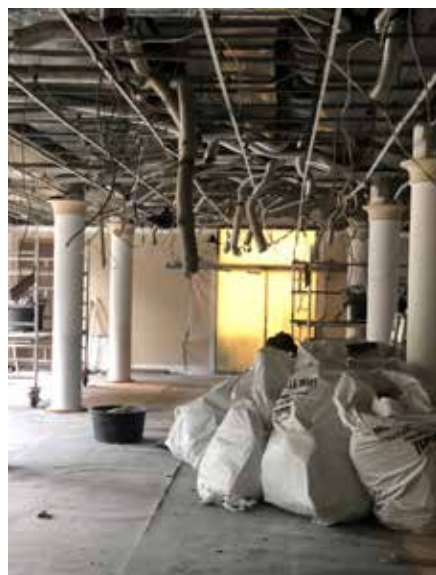
Das Restaurant ist vorübergehend eine Baustelle.

Viele Bewohnerinnen und Bewohner beobachten das Geschehen mit großem Interesse. Insbesondere, als vor einigen Tagen ein großer Kran anrückte und die neue Lüftungsanlage durch das geöffnete Dach in das Paul-Hanisch-Haus hob.